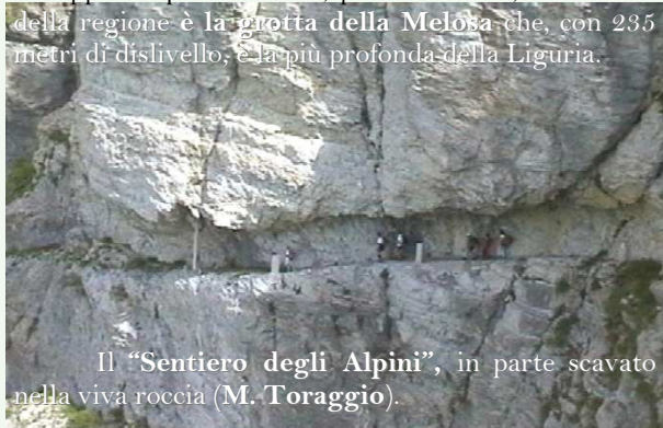
Il "Sentiero degli Alpini", in parte scavato nella viva roccia (M. Toraggio).

Anche in questa zona troviamo un substrato calcareo, sede di numerose grotte, di notevole importanza come L'Abisso della Pietravecchia, la grotta dei Rugli (a monte dell'abitato di Buggio) con uno sviluppo di quasi 2 km. e, per estensione, la seconda della regione è la grotta della Melosa che, con 235 metri di dislivello, è la più profonda della Liguria.